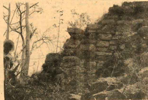
Se infiere que gran parte de las construcciones que se hallaron fueron de carácter habitacional

Podemos inferir que gran parte de las plataformas fueron de carácter habitacional, ya que en el mismo contexto y en asociación estrecha con ellas se ubican gran cantidad de metates (muelas) que formaban parte básica de los implementos domésticos.